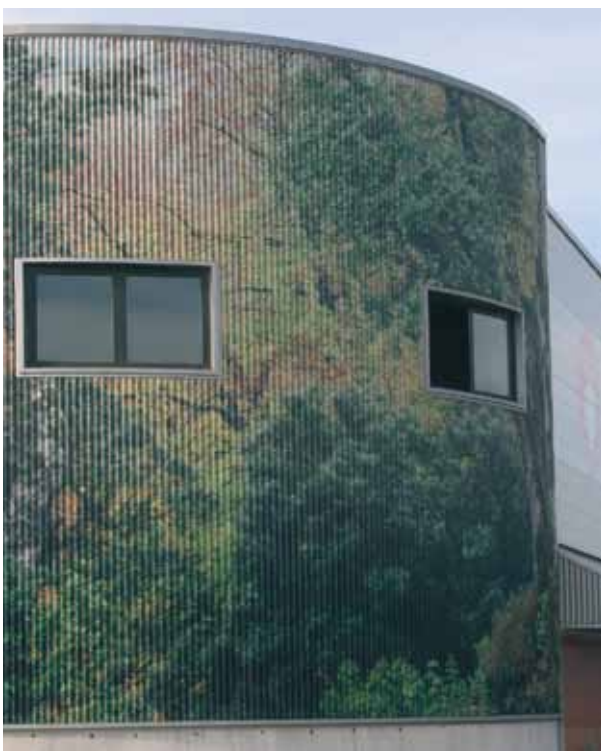
Fachada vegetal en la nave de la empresa Gasca (Amorebieta-Vizcaya)

Respecto a la seguridad que proporciona el sistema frente al fuego, el aislamiento queda garantizado por los materiales que forman del panel sándwich (chapa-lana de vidrio-chapa). En este punto es preciso hacer hincapié en dos aspectos importantes. Por un lado, incidir en