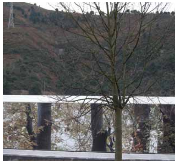
La imagen digital se mezcla con el paisaje arbóreo

La misma técnica utilizado en cubiertas se puede aplicar igualmente en fachadas, suponiendo una solución sencilla y económica para realizar aislamientos en fachadas de chapa simple ya ejecutadas. Por otro lado, las placas “HA-40/250” empleadas en este sistema pueden ser curvadas, permitiendo así su instalación en fa-