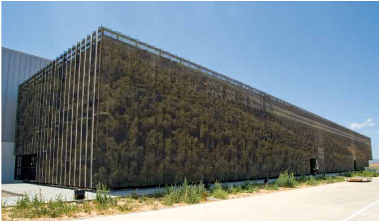
En el tratamiento de la envolvente de las oficinas de Aceites Urzante, en Tudela (Navarra) se ha buscado representar la imagen de la marca

la incombustibilidad de los productos realizados con lana de vidrio –la reacción al fuego de este material está clasificada como M0 (no combustible), según UNE 23727:1990–, cualidad que les hace completamente seguros para este tipo de edificaciones, ya que no contribuyen a la propagación de un incendio. En este sentido, se recomiendan los productos desnudos o revestidos con velo de vidrio. Por otro lado, hay que tener en cuenta la resistencia de las soluciones constructivas al fuego. Es necesario que el “sándwich in situ” sea fabricado con alma de lana de roca de alta densidad. Los valores de resistencia o estabilidad al fuego deberán venir avalados por un certificado de ensayo de laboratorio propio de cada solución.